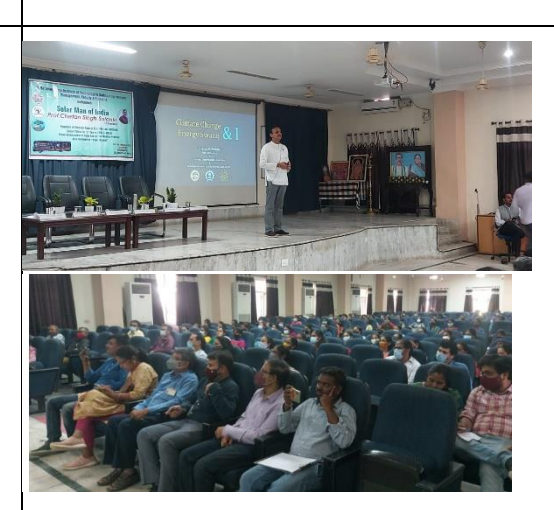
During Presentation by the professor