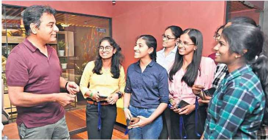
శనివారం హైదరాబాద్‌లో టీహాబ్ ఏడవ వార్షికోత్సవం కార్యక్రమంలో స్టార్టప్‌ల నిర్వాహకులతో ముచ్చటపడ్డ మంత్రి కేటీఆర్