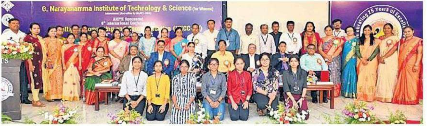
సదస్సు ప్రారంభోత్సవంలో పాల్గొన్న అంతర్జాతీయ పరిశోధకులు