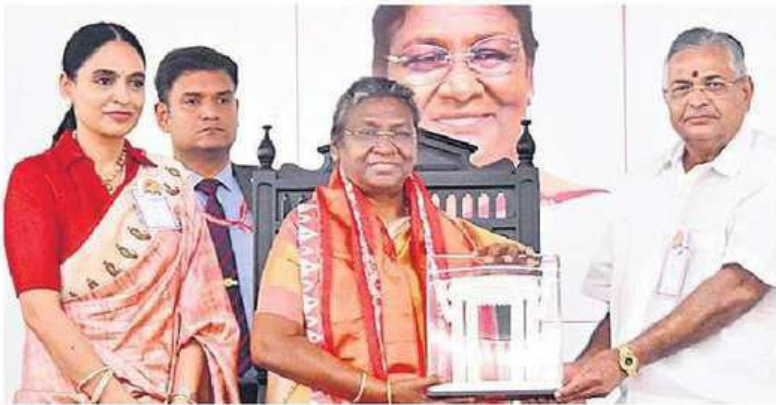
రాష్ట్రపతి ద్రౌపది ముర్ముకు జ్ఞాపికను బహుళకలిస్తున్న నారాయణమ్మ కళాశాల ప్రతినిధులు