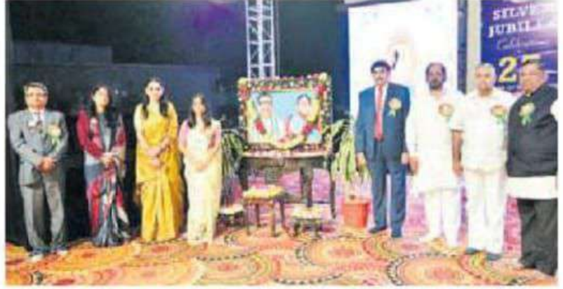
సిల్వర్ జూబ్లీ ముగింపు వేడుకలో అతిథులు